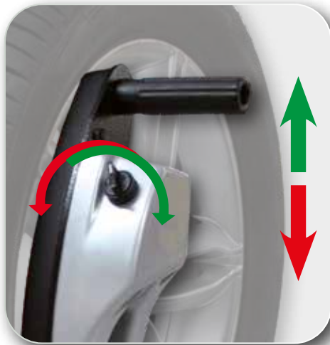
AUTOMATIQUE - AUTOMATISCH